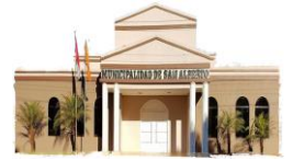
San Alberto - Alto Paraná

X DEPARTAMENTO DE ALTO PARANÁ INTENDENCIA MUNICIPAL. Telef. (0677) 20039 E-mail: munisanalberto@gmail.com