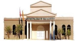
San Alberto - Alto Paraná

X DEPARTAMENTO DE ALTO PARANÁ INTENDENCIA MUNICIPAL. Telef. (0677) 20039 E-mail: munisanalberto@gmail.com