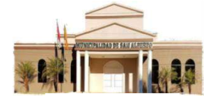
San Alberto - Alto Paraná

X DEPARTAMENTO DE ALTO PARANÁ INTENDENCIA MUNICIPAL. Telef. (0677) 20039 E-mail: munisanalberto@gmail.com