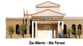
San Alberto - Alto Paraná

X DEPARTAMENTO DE ALTO PARANÁ INTENDENCIA MUNICIPAL. Telf: (0677) 20039 E-mail: munisantalberto@gmail.com