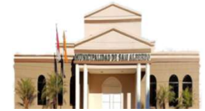
San Alberto - Alto Paraná