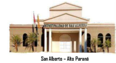
San Alberto - Alto Paraná

X DEPARTAMENTO DE ALTO PARANÁ INTENDENCIA MUNICIPAL. Teléf. (0677) 20039 E-mail: munisanalberto@gmail.com