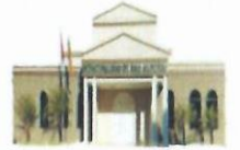
San Alberto - Alto Paraná

X DEPARTAMENTO DE ALTO PARANÁ INTENDENCIA MUNICIPAL. Telef. (0677) 20039 E-mail: comisariosanaberto@gmail.com